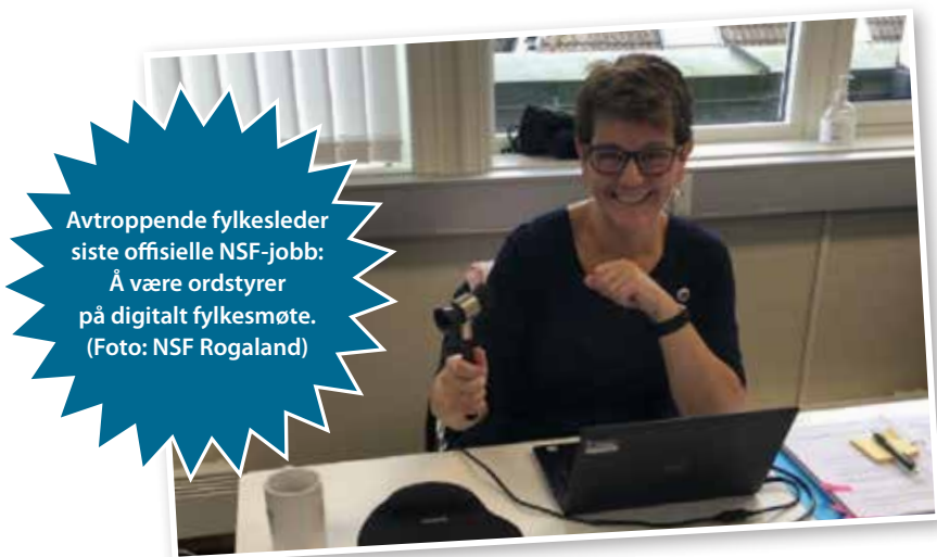
Avtroppende fylkesleder siste offisielle NSF-jobb: Å være ordstyrer på digitalt fylkesmøte.