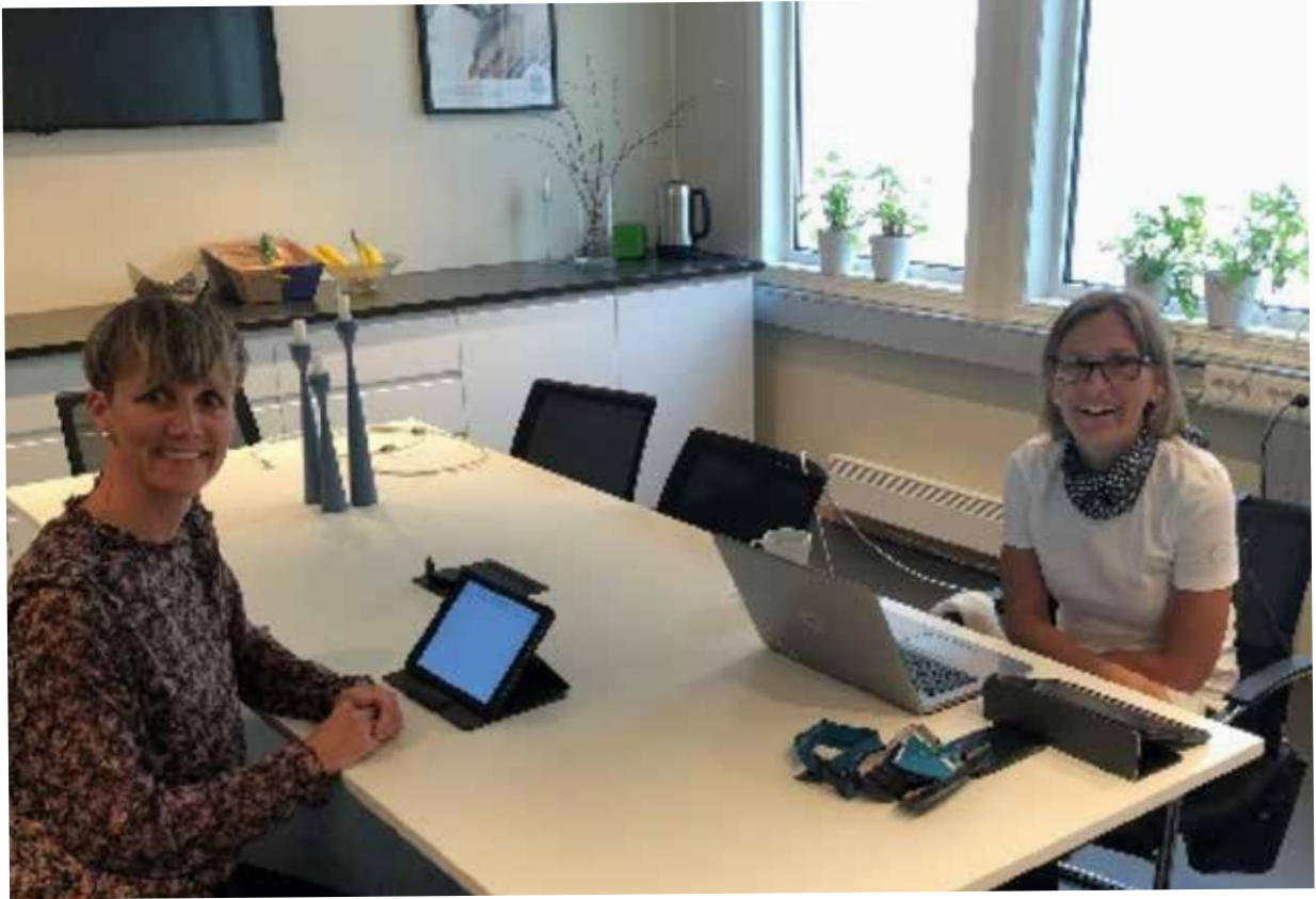
To spente og svært så blide kandidater – henvist til fylkeskontorets kjøkken mens avstemmingen foregikk.