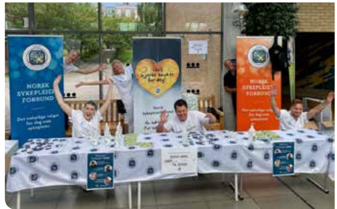
Det står ikke på entusiasmen når nye medlemmer skal verves til NSF

Med sprit, hyppig håndvask, munnbind på lur, gode retningslinjer for smittevern og en meters avstand fikk vi tre flotte dager med studentene. Alle studentene som besøkte oss på standen fikk utdelt knekkebrød, vannflasker, smittevernnøkler og håndsprit. I tillegg kunne vi skilte med ryggsekk, håndbok, gratis uniform, innbo- og livsforsikringspakke, rimelig pris på pensumbøker og rabatt på